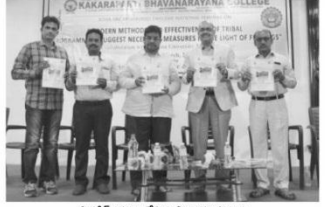
సావనీర్ బహుళ విద్యార్థులకు కృతజ్ఞతా పత్రాలు