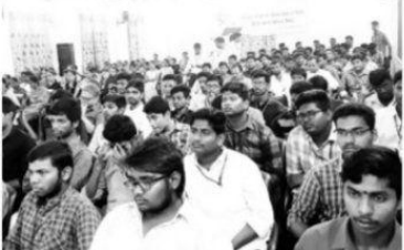
జాతీయ సదస్సులో పాల్గొన్న విద్యార్థులు