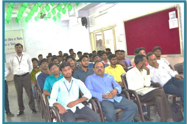
Participants at the Seminar