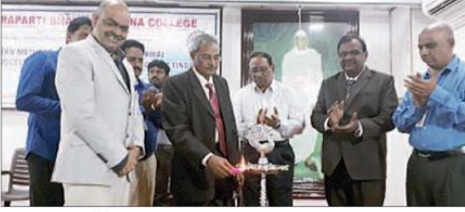
జాతీయ సదస్సును ప్రారంభిస్తున్న వియన్నారావు