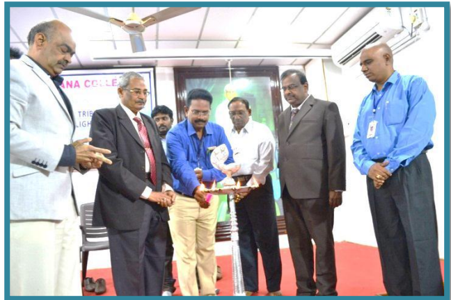
Lighting of the lamp