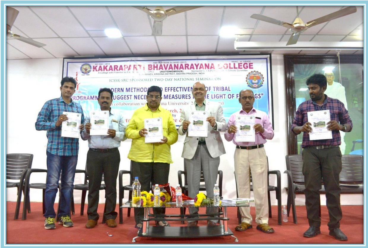
ISBN BOOK Release by delegates