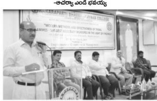
సమావేశంలో మాట్లాడుతున్న ఎం.డి భవయ్య