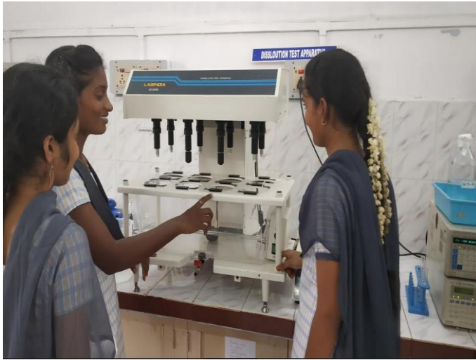
Training on HPLC