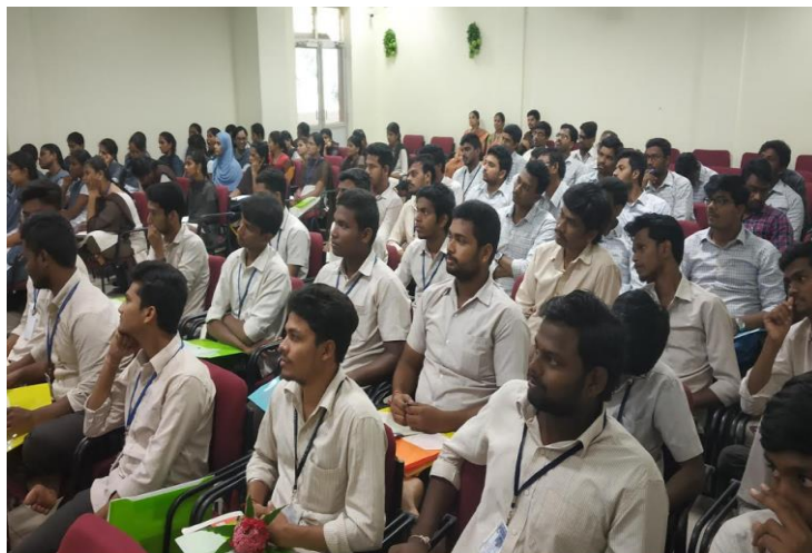
Participants at the workshop