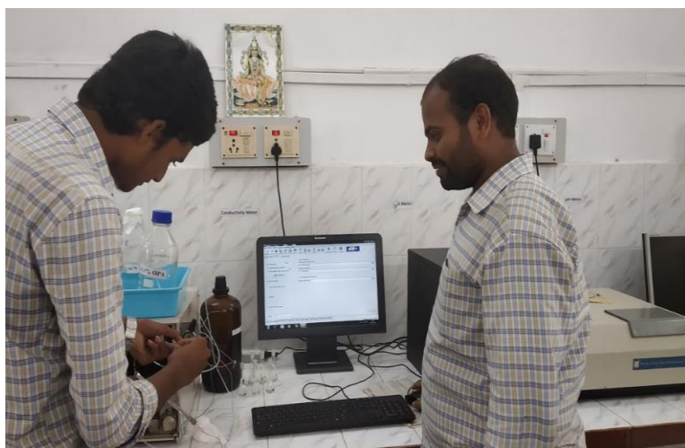
Training on UV Spectrophotometry