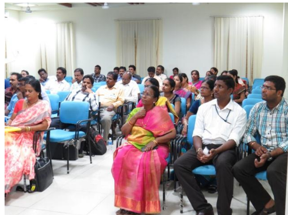
Lecturers at the Technical Session