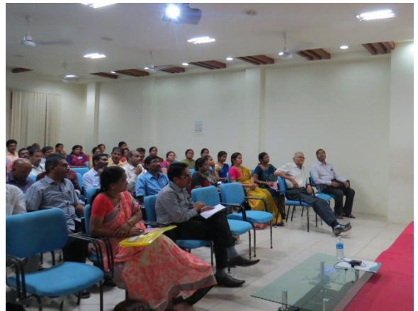
Lecturers at the Technical Session