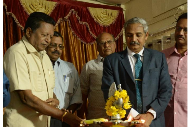
Lightening of the lamp by dignitaries