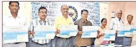
గోడ ప్రతులు విడుదల చేస్తున్న కళాశాల యాజమాన్యం