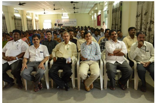
Staff at the Workshop