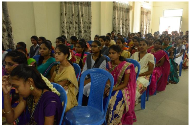
Students at the Workshop