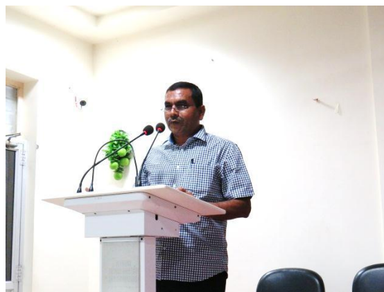
Feedback from participants