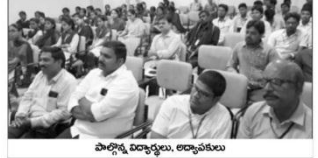
పాల్గొన్న విద్యార్థులు, అధ్యాపకులు