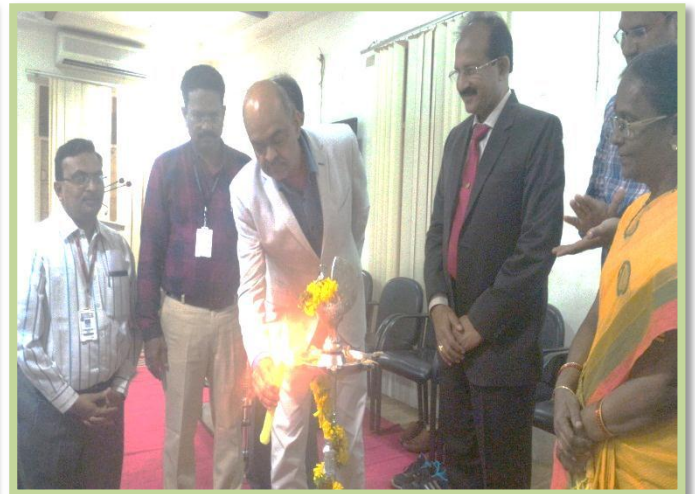
Lighting of the Lamp