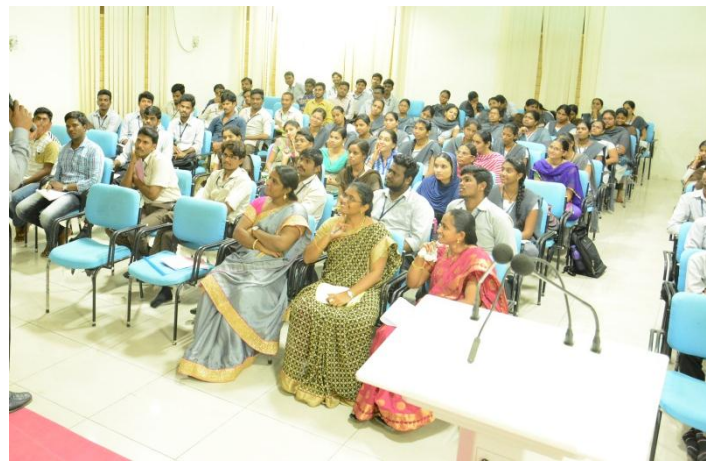
Staff & Students