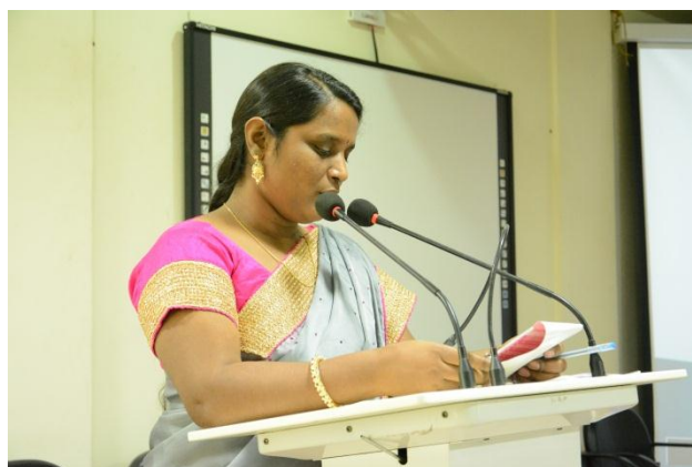
Welcoming the guests on to the dais