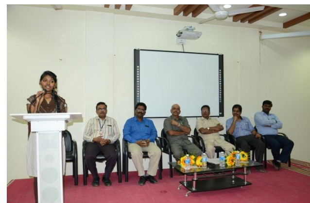
Feedback from students