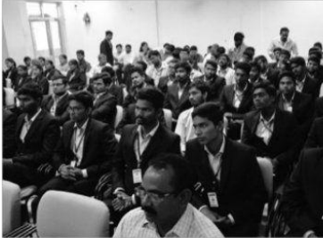
వర్క్ షాప్ లో పాల్గొన్న పి.జి.విద్యార్థులు