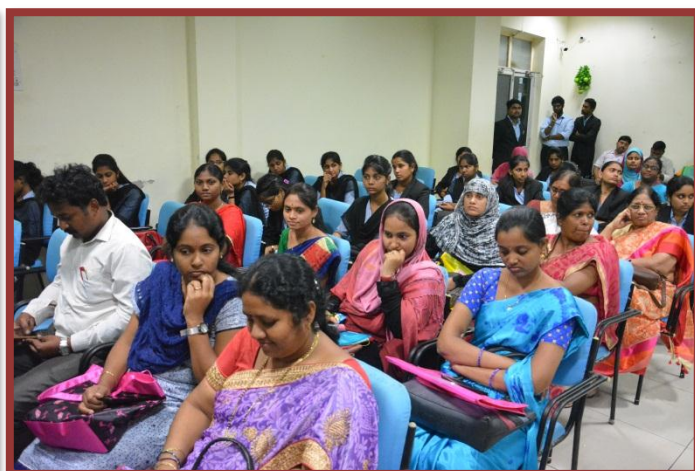
Participants at the Workshop