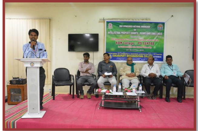
Feedback from Participants