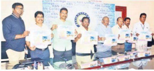
పోస్టర్ను అవిష్కరిస్తున్న కళాశాల కమిటీ ప్రతినిధులు అధ్యాపకులు తదితరులు