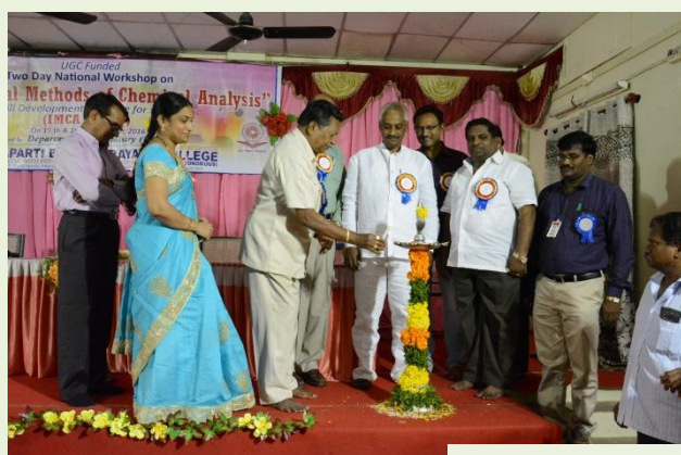
Lightening of the lamp by dignitaries