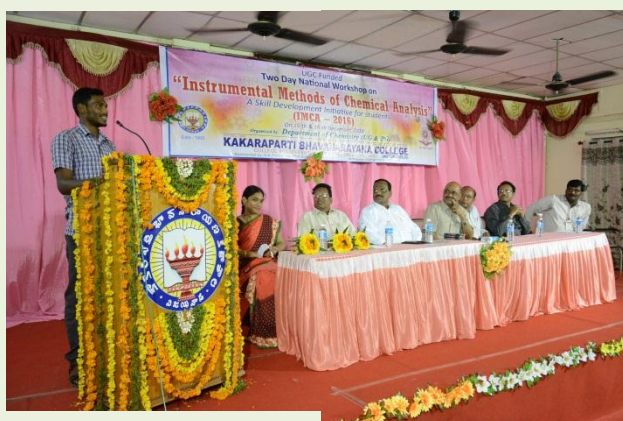
Feedback from students