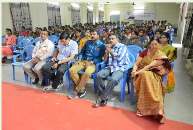
Staff & Students at the Workshop