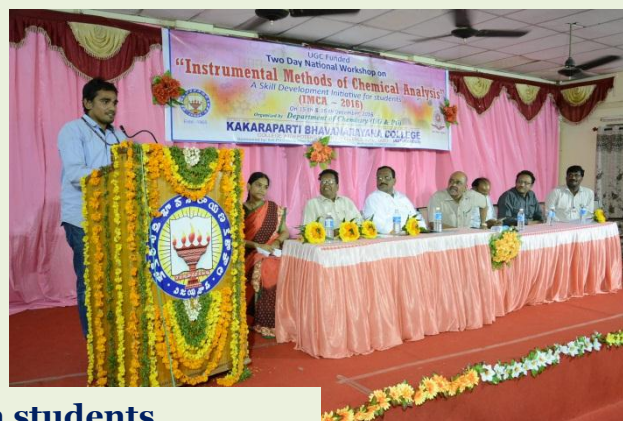
Feedback from students