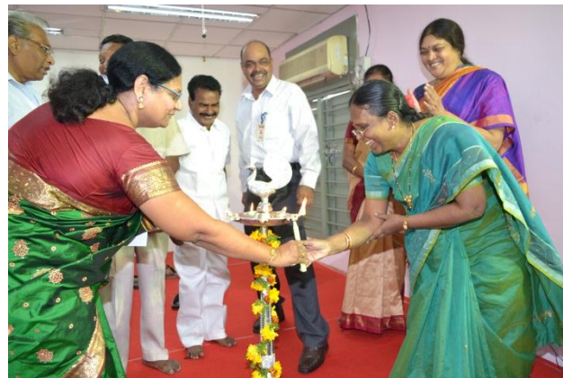
Lightening of the lamp