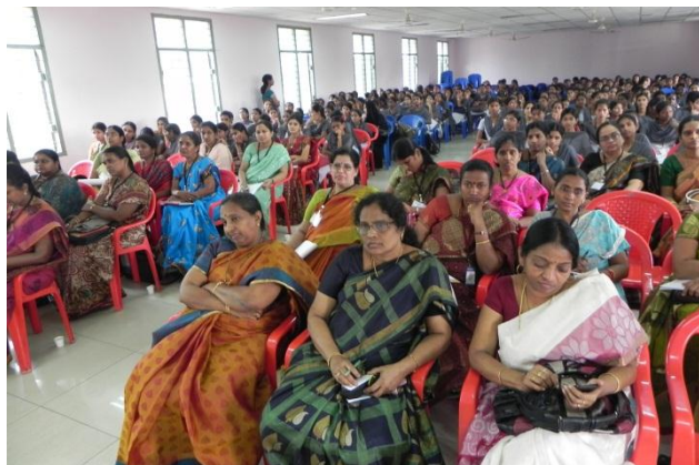
Faculty & Participants at the Workshop