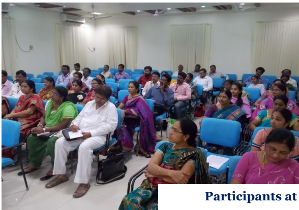
Participants at the Workshop