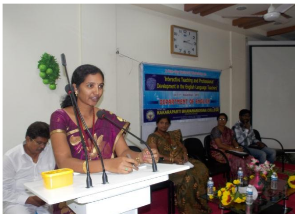
Feedback from participants