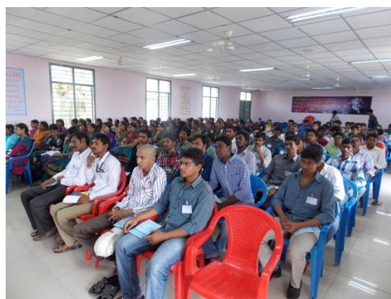
Staff & Students at the Workshop