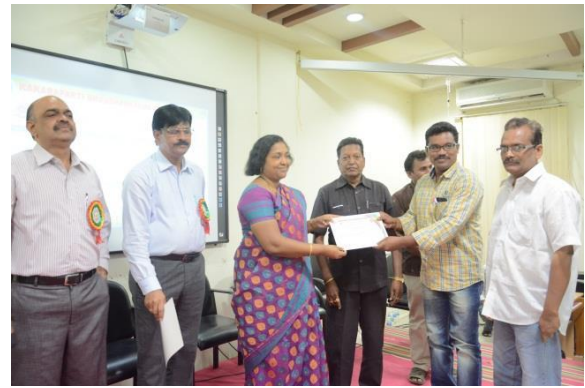
Certificates distribution to participants