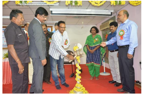
Lightening the lamp by Delegates