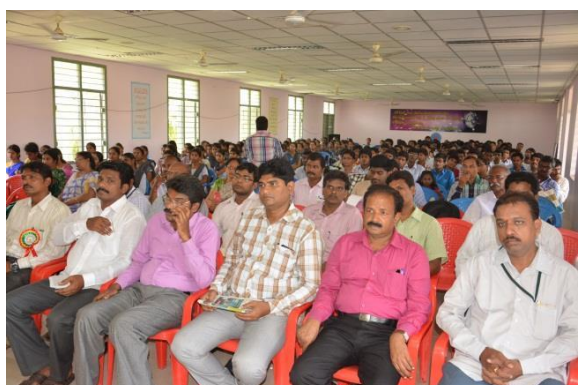
Staff & Students at the National Seminar