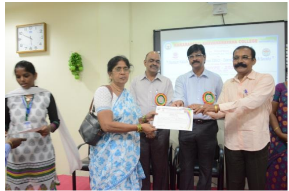
Certificates distribution to participants