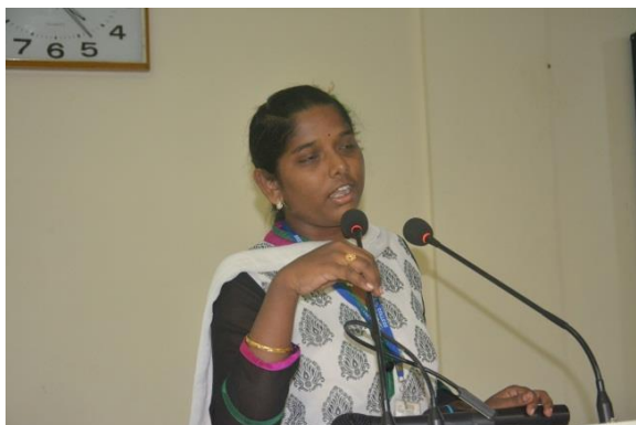
Student participating in the Oral presentation