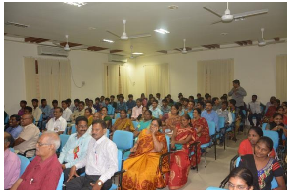
Participants at the National Seminar