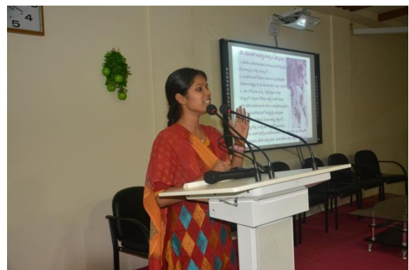
Student participating in the PPT presentation