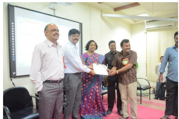
Certificates distribution to participants