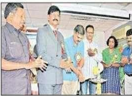
జ్యోతి ప్రజ్వలించి సదస్సు ప్రారంభిస్తున్న లతీధులు