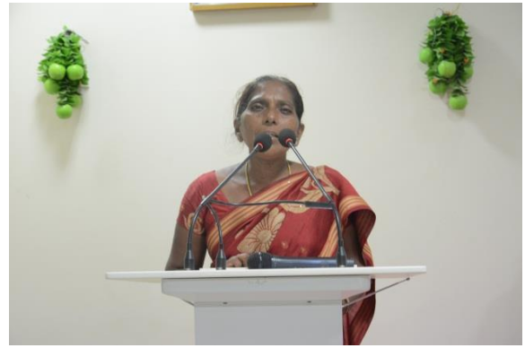
Feedback by participants