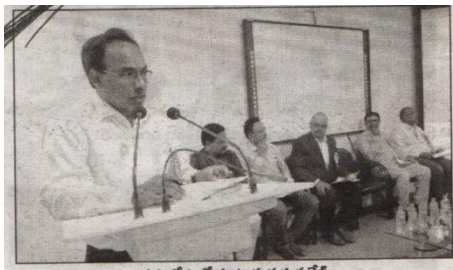
సమావేశంలో మాట్లాడుతున్న పేటి