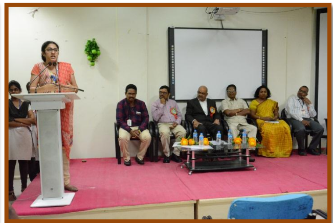
Feedback from Participants