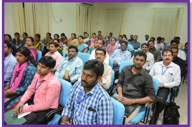
Participants at the Workshop