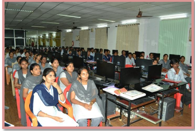
Students at the Workshop