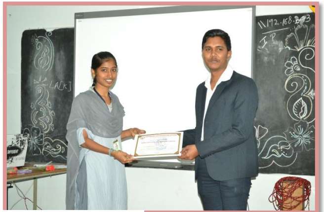
Certificate Distribution to Students