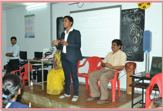
Brief Report of the Workshop by Mr. Akhil Battula