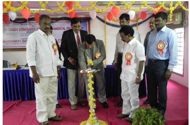
Lightening of the lamp by dignitaries