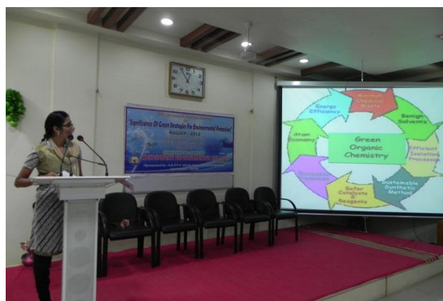
Power Point Presentation by the students