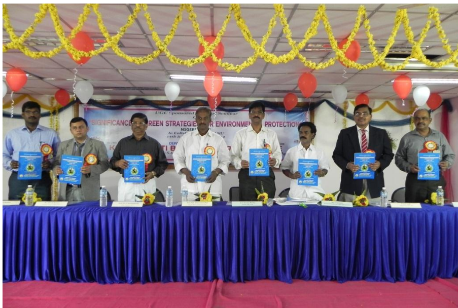
Release of Souvenir by the delegates