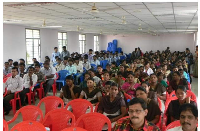
Staff & Students at the Seminar