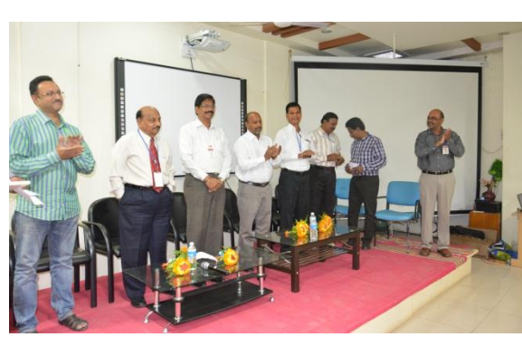
All the dignitaries on the dais