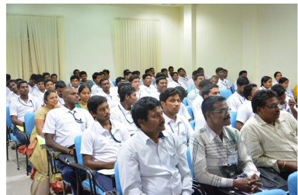
Participants at the seminar