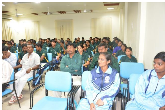
Participants in the seminar hall