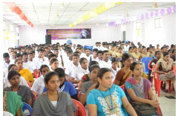
Participants at the seminar