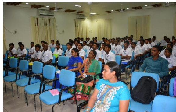
Audience at the seminar