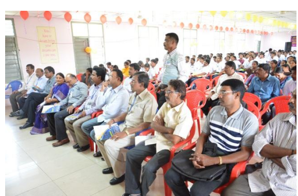
Participants in the seminar hall