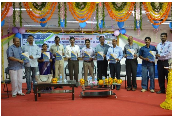
Release of the souvenir