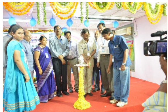
Lightening the lamp by delegates