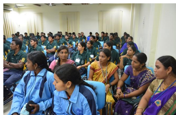
Participants in the seminar hall