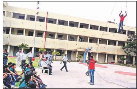
రోపేవే అడ్వెంచర్లో తర్ఫీదు ఇస్తున్న దృశ్యం