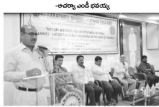
సమావేశంలో మాట్లాడుతున్న ఎం.డి భవయ్య