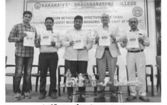
సావనీర్ దండలు చేస్తున్న పాలకుల వర్గ సభ్యులు