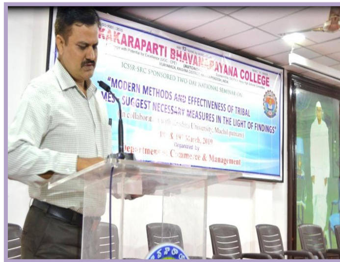
Introducing the Resource Person by Dr. K. Sivaji Ganesh, Rapporteur, Session - IV