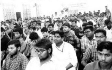
జాతీయ సదస్సులో పాల్గొన్న విద్యార్థులు