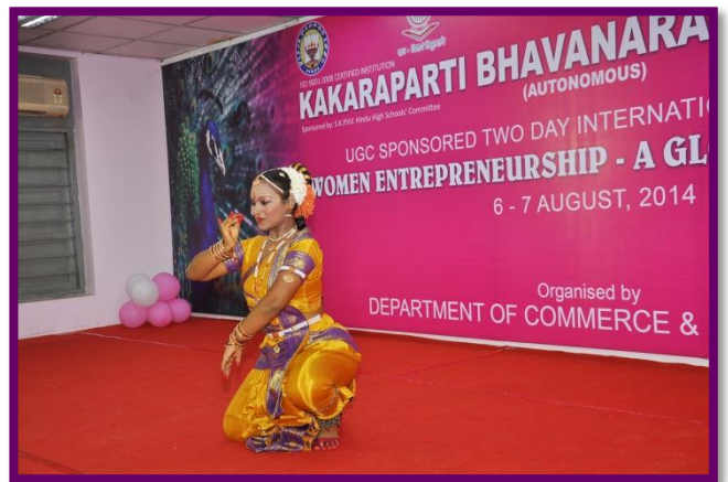
Welcome dance by the Student