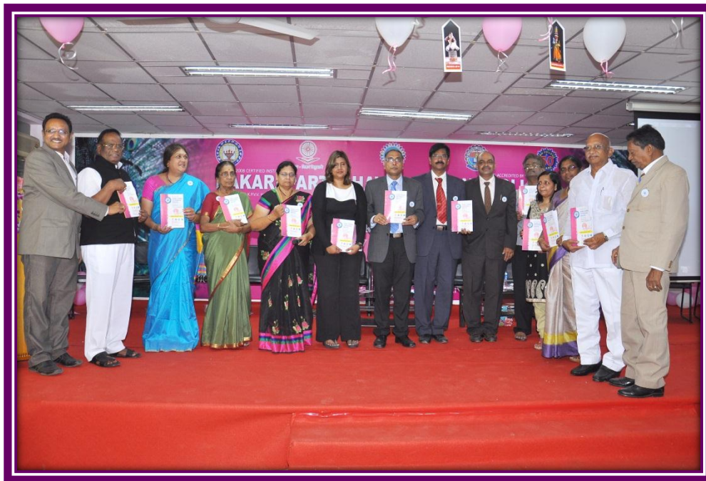
Release of Souvenir