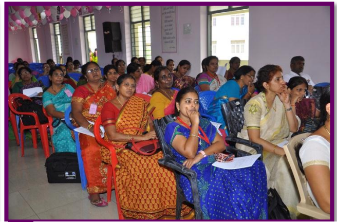
Participants at the Seminar