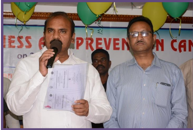
Speech by Sri. Prathipati Pulla Rao, Honourable Minister for Agriculture, AP