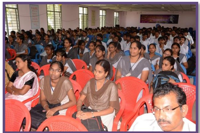
Students at the Programme