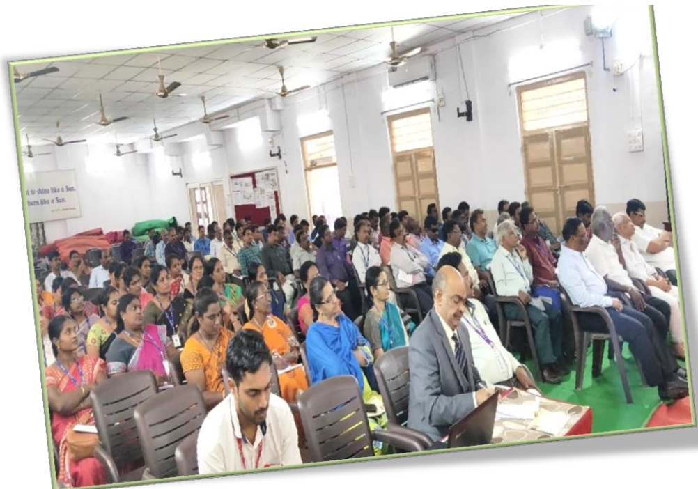
Staff at the Invited Talk